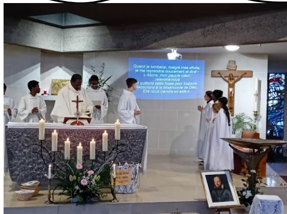
Fête patronale le 26 janvier 2025

Toutes les infos sur www.catholique95.fr/rome2025