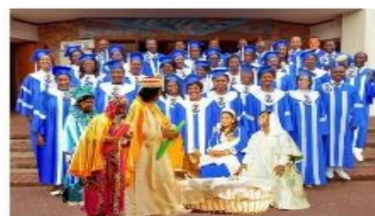
14 Décembre 2024 16h00 Eglise St-François-de-Sales