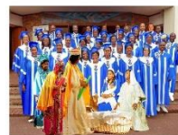
14 Décembre 2024 16h00 Eglise St-François-de-Sales